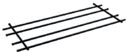
Полка - 2 шт

Предназначены для размещения обуви. Устанавливаются на полу в помещении. Изготавливаются из металла с полимерным покрытием. Поставляются в разобранном виде. Вес не более 2,5 кг. Максимальная нагрузка на полку - не более 2 кг. Общая нагрузка до 4 кг.